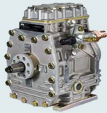
Compresor Bock FFX Hecho en Alemania.